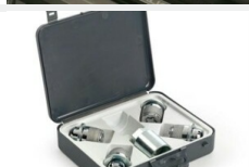
Nakrętki antykradzieżowe - chromowane Koła