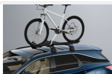
dachowy uchwyt rowerowy Bagaż