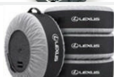
Pokrowce na koła i opony Koła