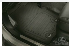
Dywaniki gumowe Dywaniki / Wykładziny