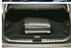
Siatka bagażnika pozioma Bagaż